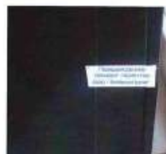
Рисунок 2 – Схема и внешний вид пломбировки регистратора от несанкционированного доступа.