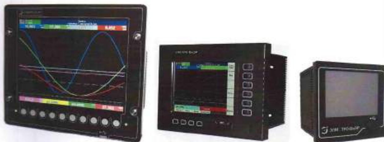
Рисунок 1 – Фотографии общего вида регистраторов

Фотографии общего вида регистраторов представлены на рисунке 1.